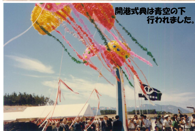
開港式典は青空の下 行われました。