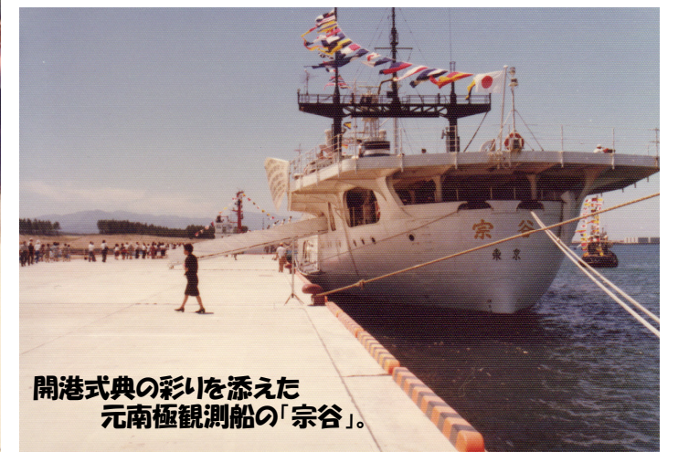
開港式典の彩りを添えた 元南極観測船の「宗谷」。