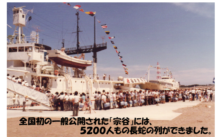
全国初の一般公開された「宗谷」には、 5200人もの長蛇の列ができました。