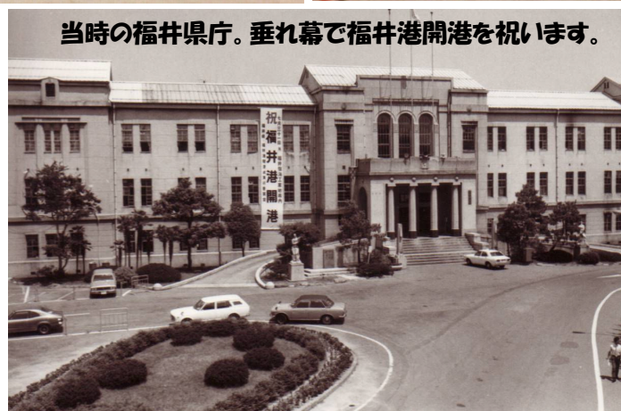
当時の福井県庁。垂れ幕で福井港開港を祝います。