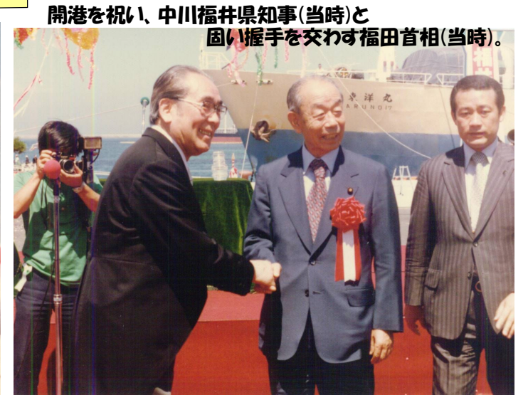
開港を祝い、中川福井県知事(当時)と 固い握手を交わす福田首相(当時)。