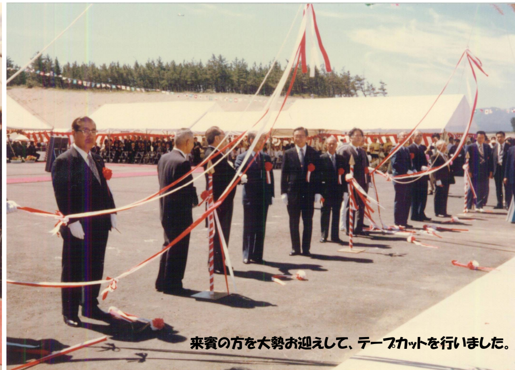
来賓の方を大勢お迎えして、テープカットを行いました。