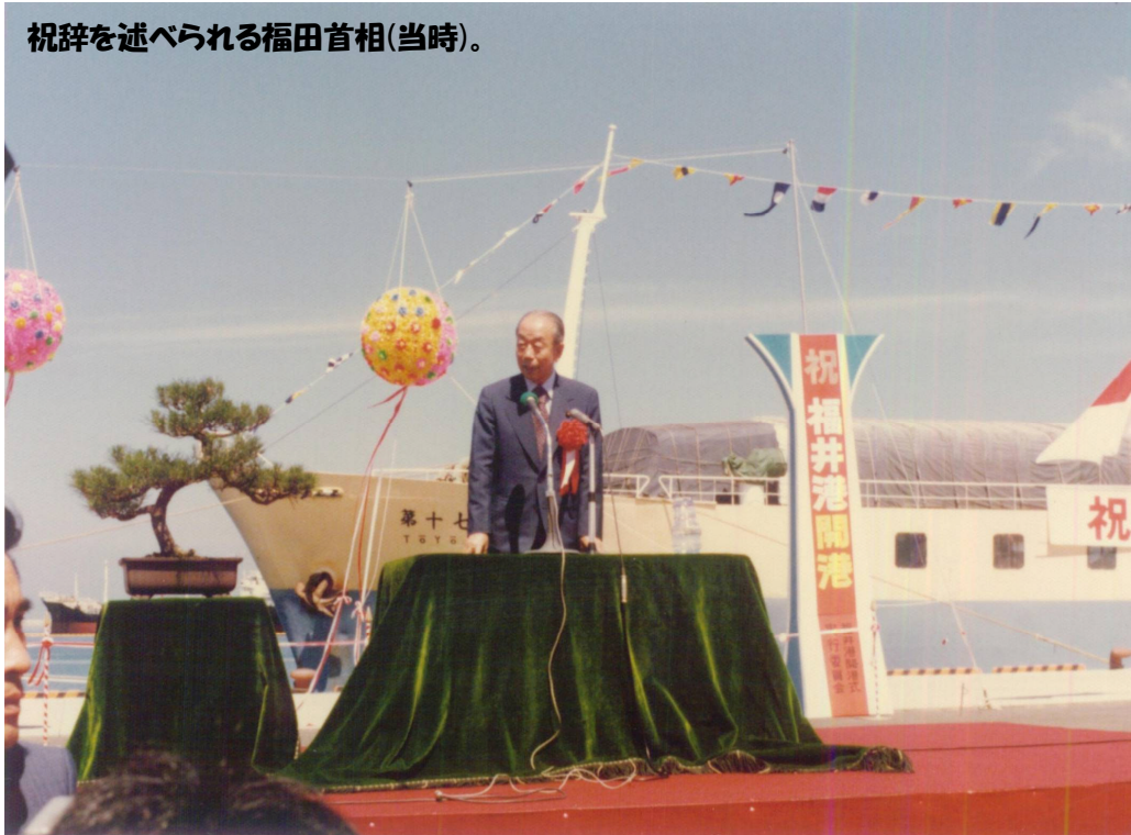
祝辞を述べられる福田首相(当時)。